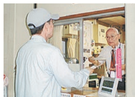
小学校での施設管理