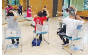
新宿いきいき体操の様子