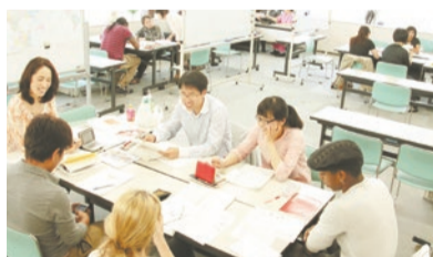
日本語教室の様子