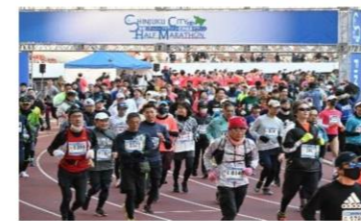
新宿シティハーフマラソン