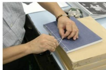
印刷・製本関連業