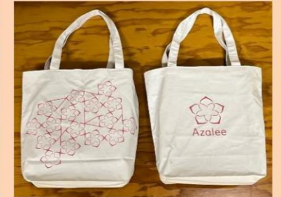
オリジナルエコバッグ