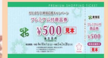
令和4年度紙商品券見本