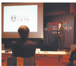
プレゼンテーションの様子

問合せ 産業振興課産業振興係(同コンテスト事務局) ☎(3344)0701・FAX(3344)0221