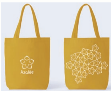
オリジナルエコバッグ

※応募方法等詳しくは、 新宿区商店会連合会公 式ホームページ「新宿 ルーペ」(右二 次元コード。 https:// shinjuku-loupe.info/) をご覧ください。