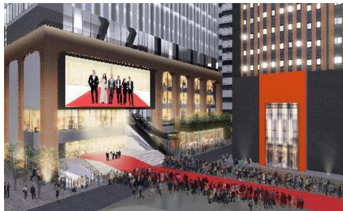
イベントイメージ