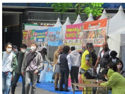
ゴールデンウィーク・アフリカン・アメリカン・カリビアンフェスタ2022