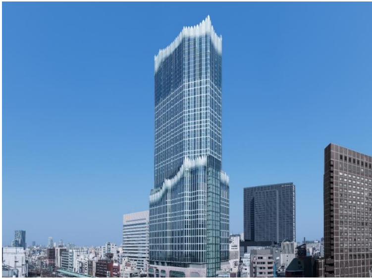
東急歌舞伎町タワー (令和5年4月14日開業)