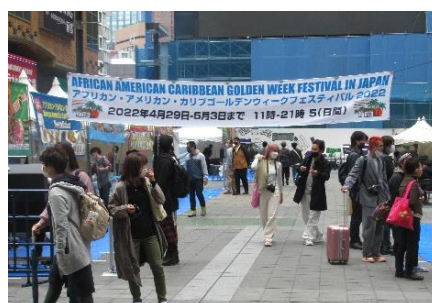
ゴールデンウィーク・ワールドミュージック・ダンス・アートフェスティバル2022