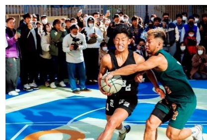
10th Anniv. Special ballaholic GAME