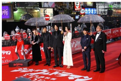
映画「シン・ウルトラマン」 レッドカーペットイベント