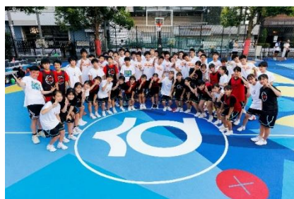
ケビン デュラント リノベーション アートコート プロジェクト 2022 完成記念イベント