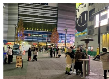
ほっと一息、憩いのPLACE KABUKICHOほっとカフェ