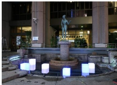
◀ 区役所通りイルミネーション・ 区役所平和の泉イルミネーション