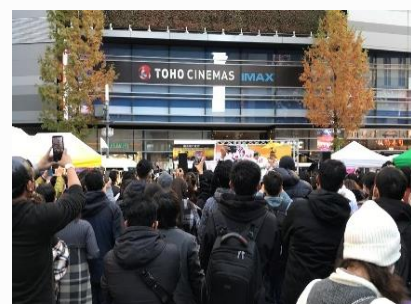
ミャンマー春の集い@新宿 ▶