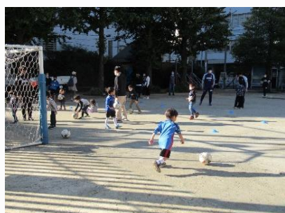
◀ しんじゅく こどもまつり

区は、NPO法人3Aの会が実施する区役所通りイルミネーションと連携し、区役所平和の泉でイルミネーションを実施しました。