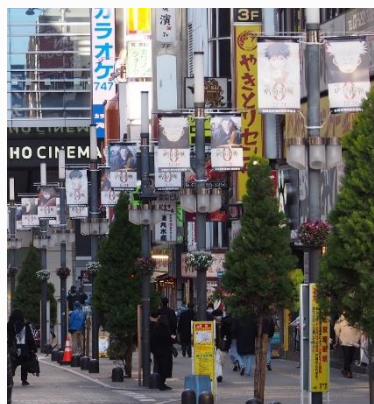
映画『劇場版 呪術廻戦0』商業広告