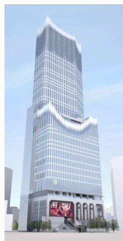
「東急歌舞伎町タワー」イメージ図▶

現在、開発が進められている「東急歌舞伎町タワー」によって、更なる賑わい空間が創出されることが期待されます。（2023年春開業予定）