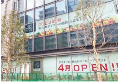
★区と(株)ダイエーは、3月1日、「食品ロス削減の推進等に関する連携協定」を締結しました。