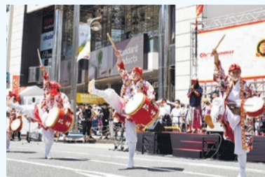
▲新宿エイサーまつり