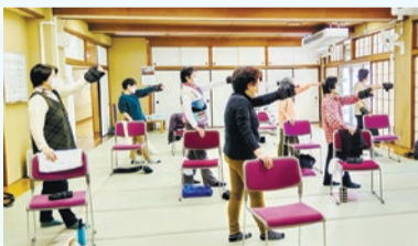
▲区オリジナル筋力トレーニング しんじゅく100トレ