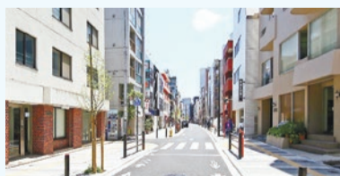
▲無電柱化した道路