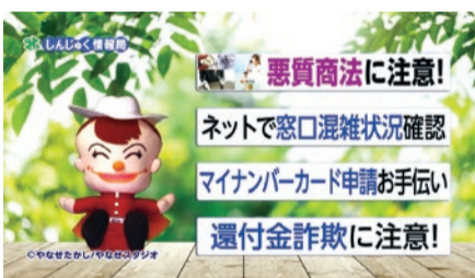
▲しんじゅく情報局の画面

※ケーブルテレビの受信については、ジェイコム東京 ☎0120(999)000へ。