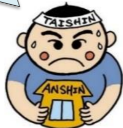
建築物等耐震化支援事業 イメージキャラクター「耐震くん」

「令和9年度末までに耐震性の不足する住宅をおおむね解消する」という目標に向け、着実に進捗しています！