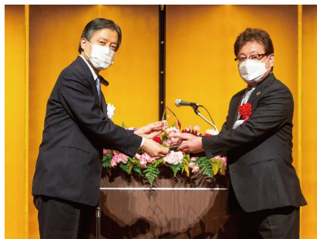
令和3年度 表彰式の様子

このイベントは区民からなる実行委員会と新宿区が協働して 企画・運営をしています。