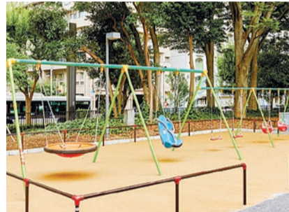
▲自分に合ったシートを選べるブランコ

誰もが利用できるインクルーシブの視点を取り入れた遊具や、小さな子ども向けの遊具を多数備えた乳幼児専用の遊び場、さまざまな年代の子どもが遊べるよう大小2つのすべり面がある大型すべり台など、子どもたちが安心して楽しめる魅力的な遊具を整備しました。