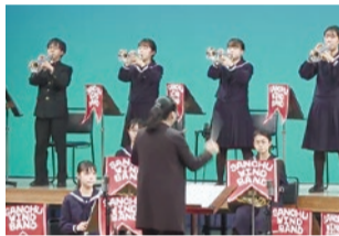
▲セレモニーの様子 (牛込第三中学校吹奏楽部の演奏)

セレモニーでは、平和へのメッセージを伝える音楽やトーク、パフォーマンス等が披露されました。