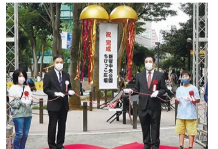
▲完成記念式典の様子