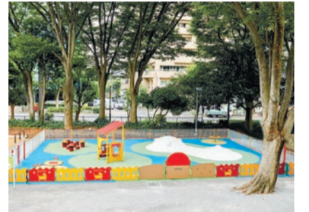
▲乳幼児専用の遊び場