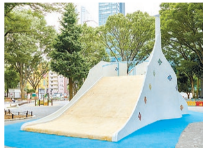
▲グレードアップしたすべり台