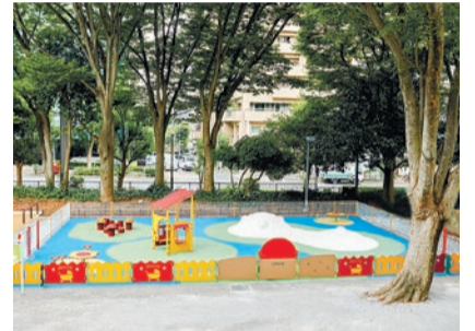
▲乳幼児専用の遊び場