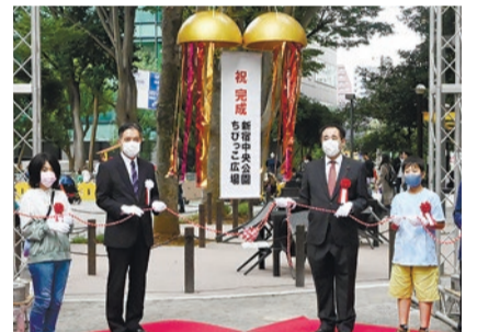
▲完成記念式典の様子