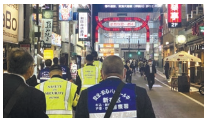
▲歌舞伎町の夜間パトロール