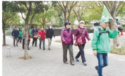
▲ウォーキングイベント