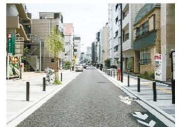
▲バリアフリー化した道路

▶染色と印刷・製本関連団体による「Azalée」プロジェクトで企画・開発した商品の周知活動を支援