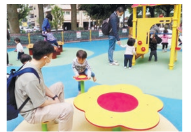
▲リニューアルした新宿中央公園ちびっこ広場