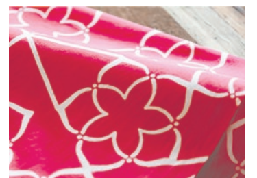
▲「Azalée」プロジェクトで企画・開発した手ぬぐい