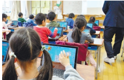
▲タブレット端末を使った授業

▶民間提案制度の活用による、部活動指導の質の向上と、教員の勤務環境の改善・働き方改革を推進