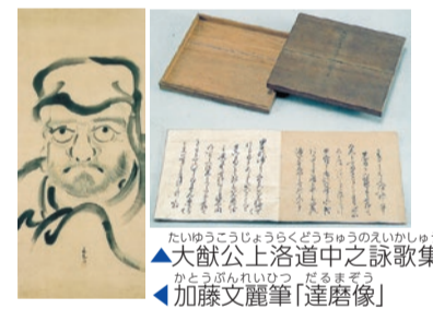
▲大猷公上洛道中之詠歌集 ▲加藤文麗筆「連磨像」

問合せ ▶文化観光課文化資源係(第1分庁舎6階) ☎(5273)4126、▶同館 ☎(3359)2131