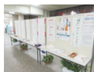
▲昨年のパネル展示