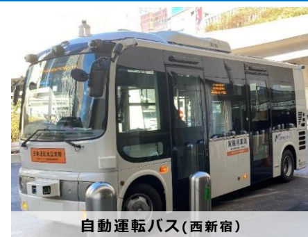
自動運転バス(西新宿)