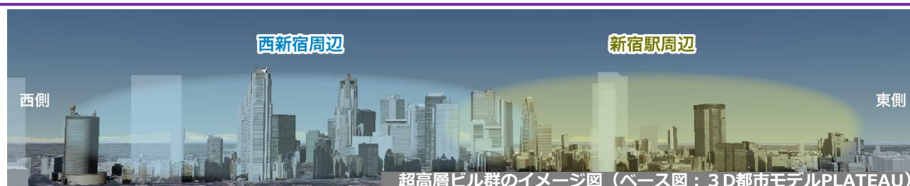
超高層ビル群のイメージ図（ベース図：3D都市モデルPLATEAU）