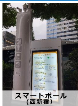
スマートポール(西新宿)