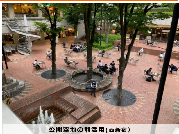
公開空地の利活用(西新宿)