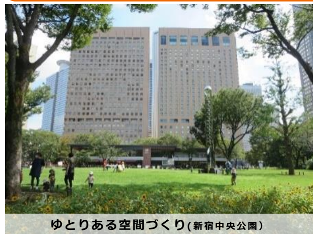
ゆとりある空間づくり(新宿中央公園)