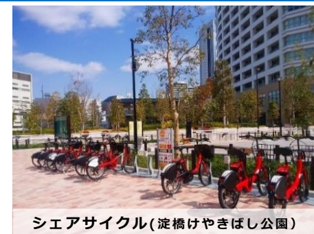
シェアサイクル(淀橋けやきばし公園)