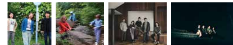
サニーデイ・サービス Buffalo Daughter bonobos MONO NO AWARE

都市型音楽フェスを新宿で開催! SHIN-ONSAI 2022 11.5sat - 6sun 11:30(開場) 12:30(開演) 有料