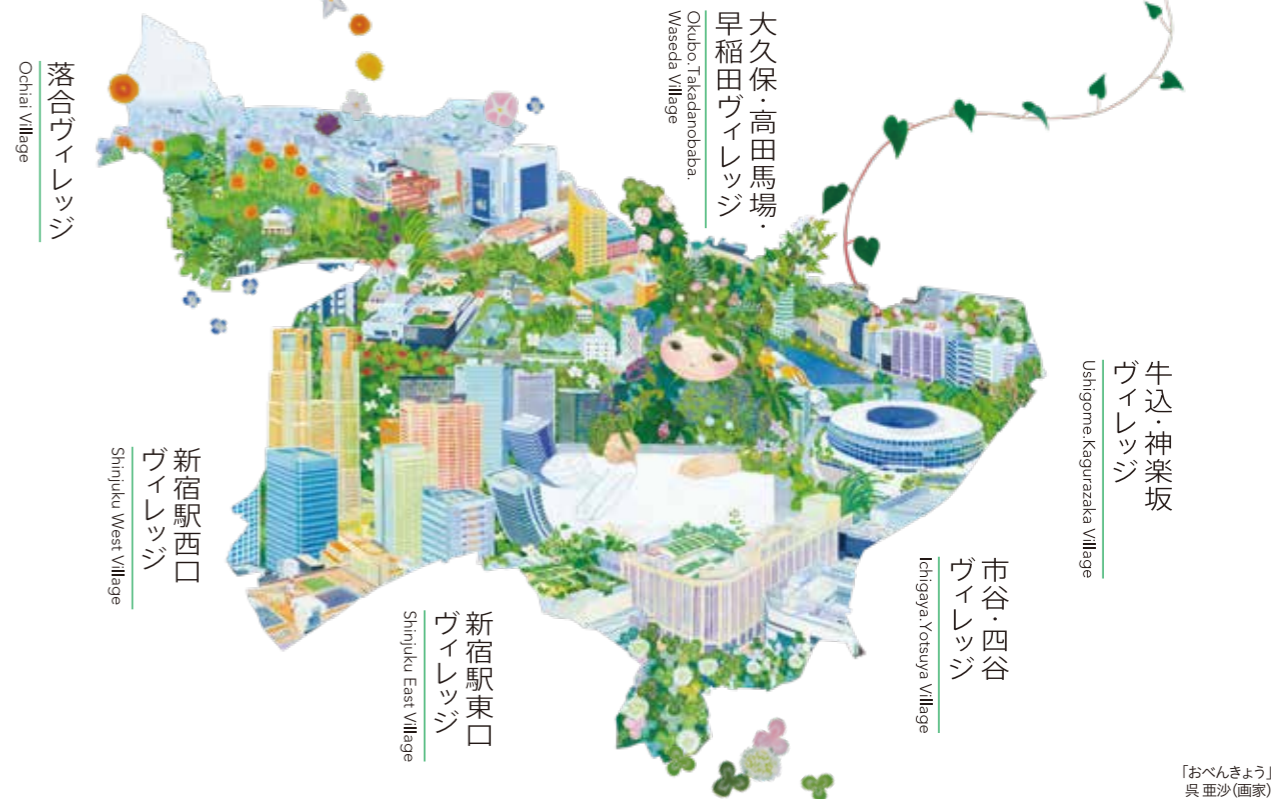
【おべんきょう】 呉 亜沙(画家)