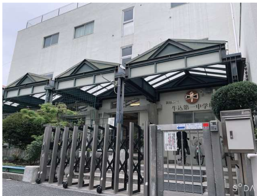
(現牛込第一中学校正門)