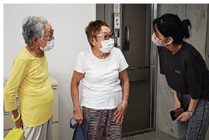
▲参加者の皆さんと講師(右)