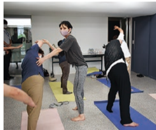
◀▶ ヨガ教室の様子 (毎月第2土曜日に開催)