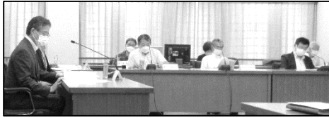
《 審 議 会 の 様 子 》

7月7日に開催した第113回新宿区住居表示審議会では、市谷薬王寺町地域の住居表示実施の内容について、報告と審議がありました。