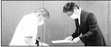
《区長に答申を渡す審議会会長》