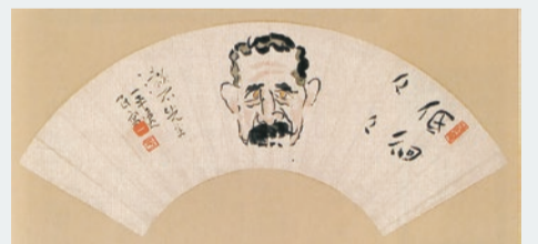
▲岡本一平扇面額「低徊々々 漱石先生」 画家・漫画家・文筆家の岡本一平が描いた作品。扇面に描かれた夏目漱石像は他に例がなく貴重。