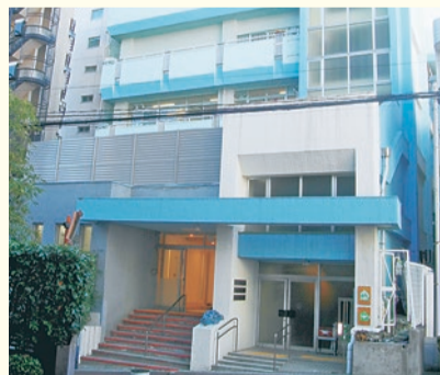
▲ささえーる 薬王寺