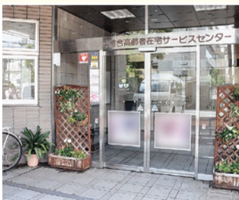
▲ささえーる 中落合

問合せ 地域包括ケア推進課高齢いきがい係(本庁舎2階) ☎(5273)4567・FAX(6205)5083