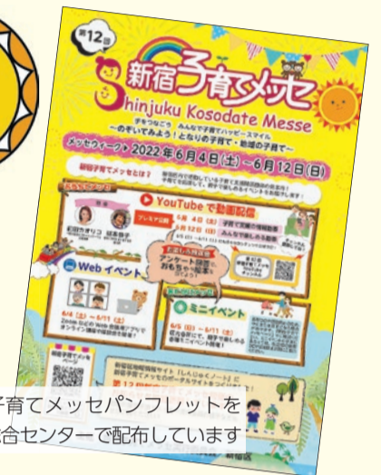
▶新宿子育てメッセパンフレットを子ども総合センターで配布しています

問合せ 同実行委員会事務局(新宿7-3-29、子ども総合センター内) ☎(3232)0695・FAX(3232)0666