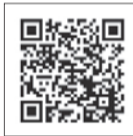
▲新宿子育てメッセYouTubeチャンネル

区内で活動する団体の活動の様子や親子で楽しめるショーやワークショップ等を動画で紹介します(右二次元コード。📄 https://www.youtube.com/channel/UC7URL99DlavG76wbPzKg7w )。