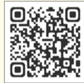
▲しんじゅくノート新宿子育てメッセページ