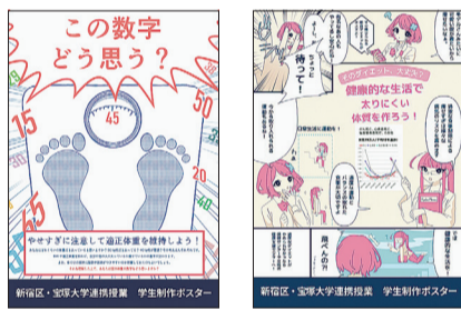
▲展示するポスターの一部