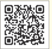
▲イベント予約ページ