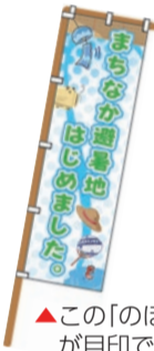
▲この「のぼり」が目印です