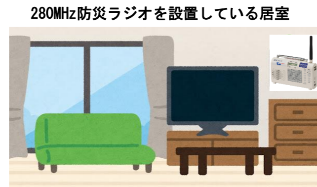
◎室内で防災行政無線の放送を聴取可能