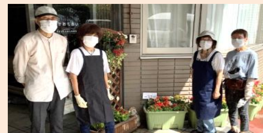
※写真:高齢者等支援団体「はなさぼ」がささえーる中落合に寄せ植えを作ってプレゼントしていただきました。