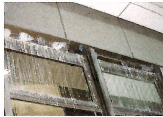
▲ビルの窓のよごれ