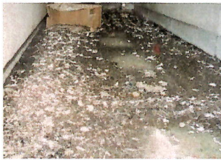
▲アパート通路のよごれ