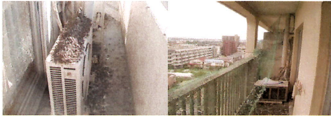
▲マンションベランダのよごれ