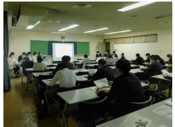
第1回勉強会の様子

次回（第2回）の勉強会は、新型コロナウイルスの感染拡大状況を鑑み、開催時期を検討中です。次回の開催が決まり次第、改めて開催通知を皆様へ送付させていただきますので是非ご参加下さい。