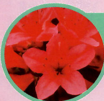
キリシマツツジ系 紅霧島（べにきりしま）

つつじが岡を代表するツツジです。花は鮮紅色の一重咲きです。花期には花が枝を覆い、見事な景観を呈します。