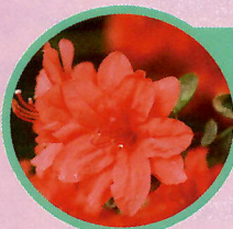
キリシマツツジ系 八重霧島（やえきりしま）

本霧島の二重咲きになったもので、花は鮮紅色の二重咲きです。本霧島と同じく有名な古品種です。