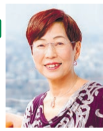
▲上野千鶴子

YouTubeを利用してフォーラムの動画(2時間程度)を3月18日(金)～31日(木)に配信します(字幕あり。通信費等は申込者負担)。