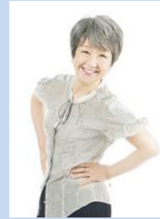
音楽：綾戸 智恵 （ジャズシンガー）