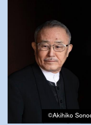
音楽：山下 洋輔 （ジャズピアニスト）