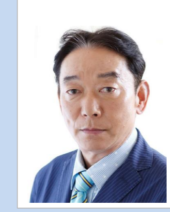
朗読：石丸 謙二郎 （俳優）