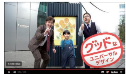
動画③：損保美術館前

UDまちづくりをテーマに、お笑い芸人と子どもと一緒に、UDの考え方を学ぶほか、新たにオープンした区内施設を探検するなど、全5本の動画で、まちのUDへの気づきを促します。