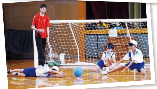
▲ゴールボールの体験学習(西新宿小学校、平成28年6月)

また、今回の競技観戦は、希望した児童・生徒の参加であったため、不参加となった児童・生徒もいましたが、各校では、参加の有無にかかわらず障害者理解教育の学びを深めることができるよう、今後の教育活動を工夫していきます。