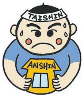
▲耐震化支援事業イメージ キャラクター 耐震くん