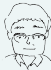
公園管理事務所 (公園財団) つねと

新型コロナウイルス感染症拡大の影響により、公園の利用価値の見直しも進み、利用層や利用形態の変化が見られます。今後も誰もが安心安全に公園を利用できるよう、施設の魅力を最大限に発揮し、さらなる公園の価値向上に努めていきます。