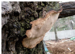
シイサルノコシカケ (樹木の心材を腐らせませす)

キノコが生えている樹木は弱ってきている証拠です。特に上 記のキノコは心材や根株を腐らし、樹木が突然倒れてくる恐れ があります。