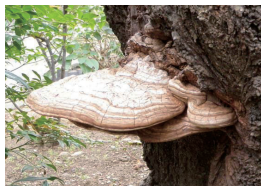
コフキササルノコシカケ (樹木の心材を腐らせませす)