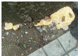
ベッコウタケ (樹木の根株を腐らせませす)