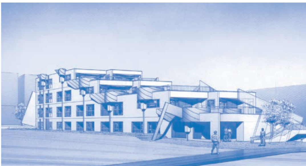
区立早稲田南町コーポラス

★問い合わせ先 新宿区都市計画部 住宅課区立住宅管理係 ☎5273-3787 FAX 3204-2386