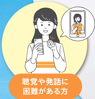
聴覚や発話に 困難がある方