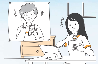
●家族や友人との会話