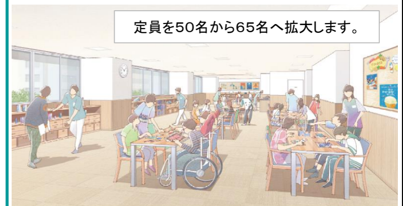
内観パース（地下1階）

生活介護事業へのニーズが高まっていることから、定員を50名から65名に拡大し、それに伴うスペースを確保するほか、短期入所を3床から4床に増床し、障害者の日常生活の充実を図ります。 また、専用エレベーターの設置等、利用者の特性を考慮した安全・安心な施設づくりとしています。