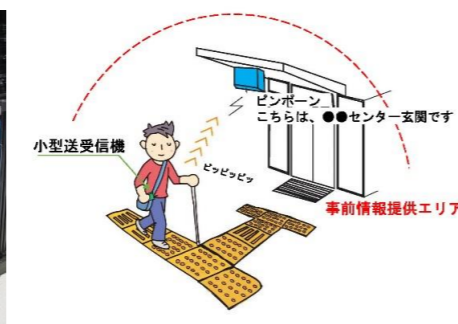
音声標識ガイドシステム