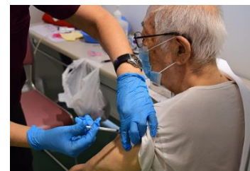
の ワ ク チ ン 接 種