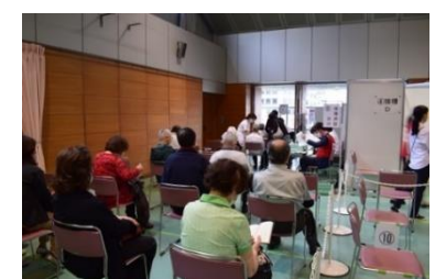
接 種 後 の 経 過 観 察