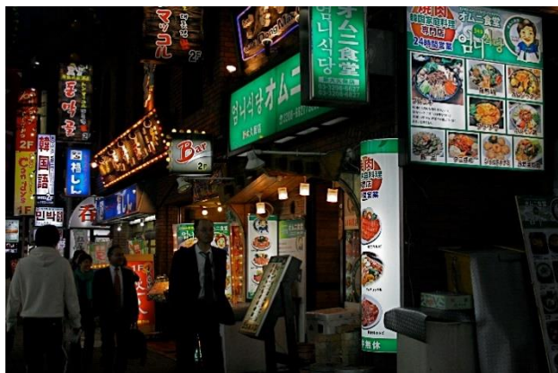
国際色豊かな景観（新大久保）