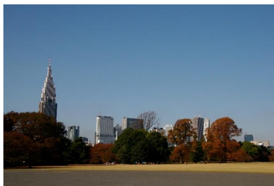
新宿御苑からの眺望景観