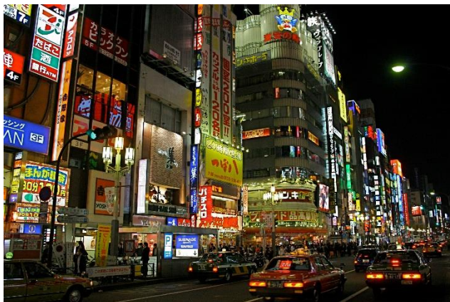
賑わいを創出する夜間景観（歌舞伎町）