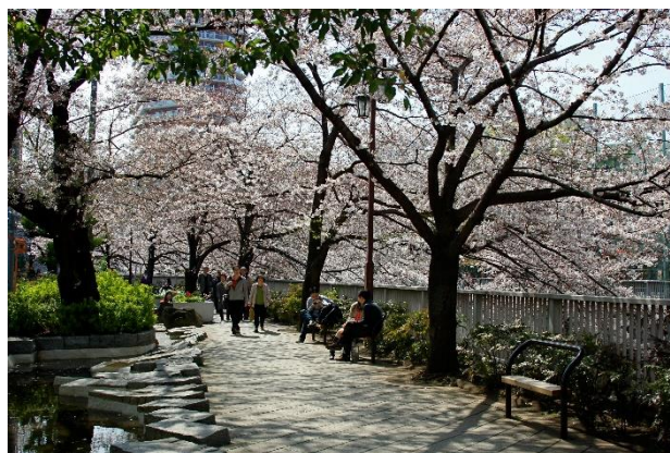
日本らしい景観（神田川）