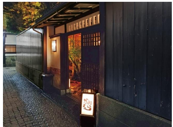
落ち着いた雰囲気での夜間景観（神楽坂）