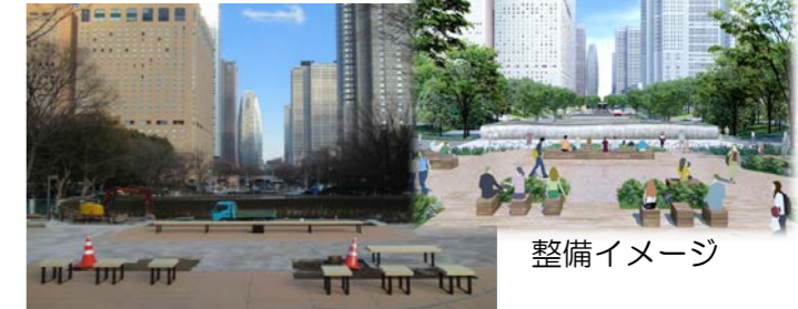
現在の整備工事の状況