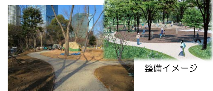
現在の整備工事の状況