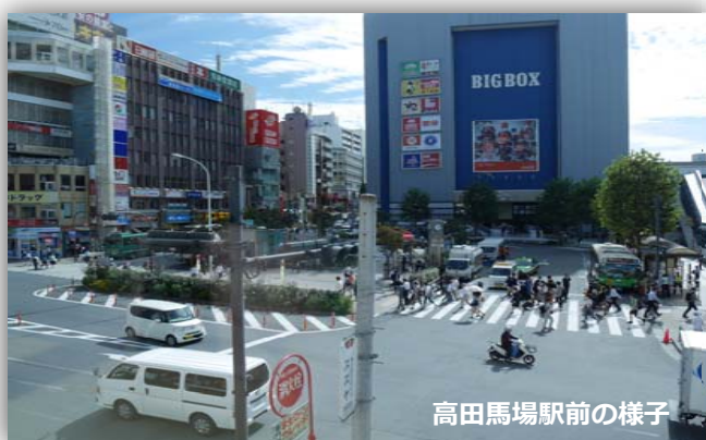
高田馬場駅前の様子