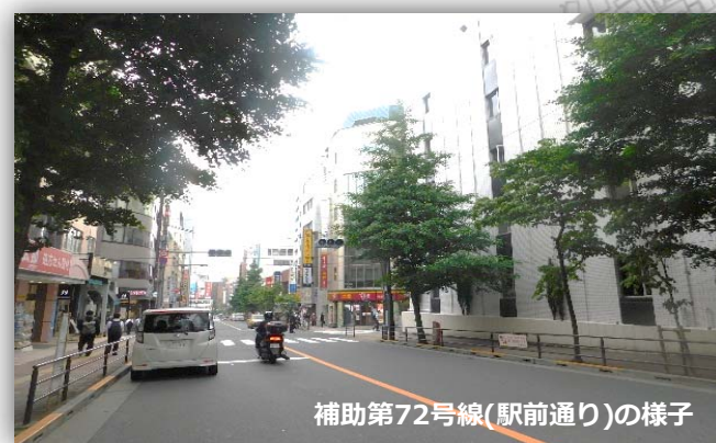
補助第72号線(駅前通り)の様子