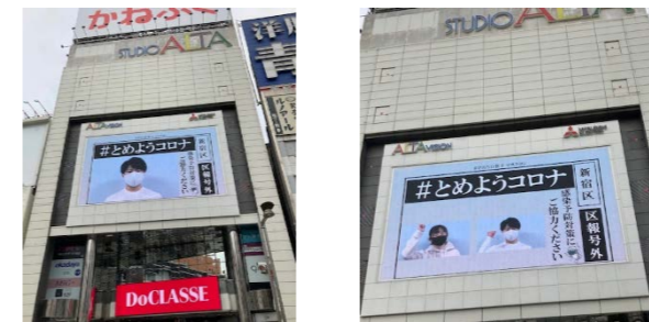
大型ビジョンで放送中