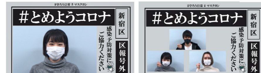
若者たちからの熱いメッセージ