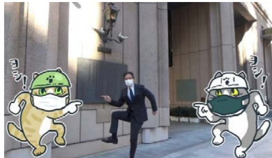
仕事猫とおなじみの「ヨシ！」ポーズを取ったのち、感染予防を訴える区長