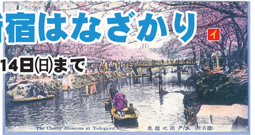
▲絵はがき(桜名所)江戸川の桜花

区内には、新宿御苑や神田川遊歩道などの桜やツツジ・山吹など歴史や伝説に登場する花の名所があります。今回は同館所蔵の新宿の花を描いた錦絵・絵画など約60点を展示します。