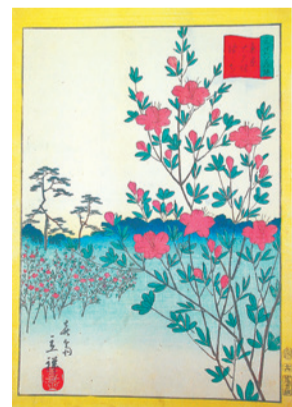
三十六歌撰東京大久保津々地

【会場・問合せ】同館(四谷三栄町12-16) ☎(3359)2131・☎(3359)5036へ。