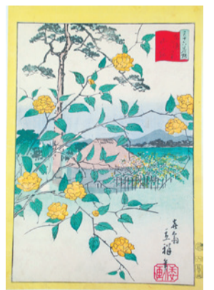
三十六歌撰東京山吹の里山ふ記