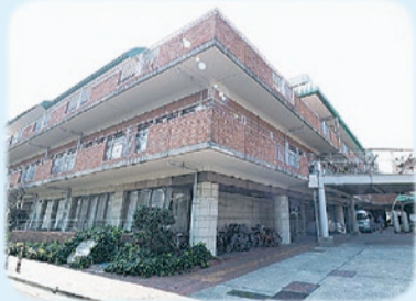
▲柏木高齢者総合相談センター(かしわ苑内)

現柏木・角筈高齢者総合相談センターは、名称を「角筈高齢者総合相談センター(★2)」に変更し、現所在地で引き続き角筈地域を担当します。