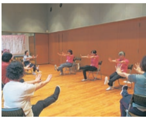
新宿いきいき体操講習会

▶認知症高齢者への支援体制の充実…「認知症高齢者の早期発見・早期診断体制の充実」「認知症にかかる医療・福祉・介護の連携強化」「認知症についての理解をさらに広め、認知症があってもなくても同じ地域でともに生活できる環境づくり」