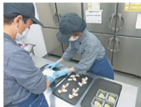
福祉作業所でのパンの製造