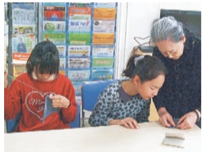
地域での多世代交流