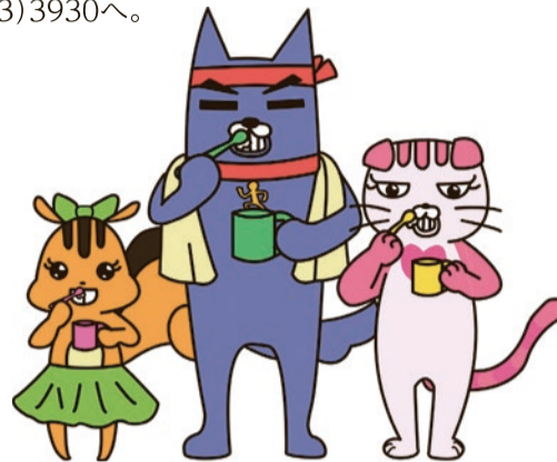
◀しんじゅく健康フレンズ

【問合せ】健康づくり課健康づくり推進係(第2分庁舎分館1階) ☎(5273)3047・FAX(5273)3930へ。