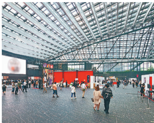
今年度の会場となる新宿住友ビル「三角広場」

【内容】式典、ステージイベント、新宿区に縁のある著名人によるビデオメッセージほか