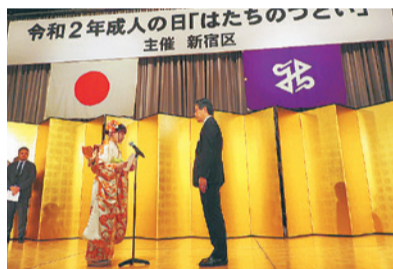
昨年の宣誓の様子

【対象】区内在住の新成人、若干名 【申込み】電話で10月29日(木)までに総務課総務係(本庁舎3階) ☎(5273)4209・FAX(3209)9947へ。応募者多数の場合は選考で決定。