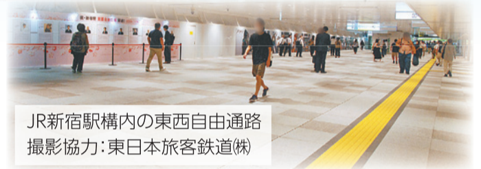
JR新宿駅構内の東西自由通路