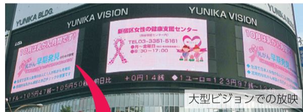
大型ビジョンでの放映

女性の健康支援センターでは、毎年10月のピンクリボン月間に合わせ、多くの方に乳がん検診を受診していただけるよう、区内で啓発フラッグの掲出や街頭大型ビジョンでの周知動画の放映等を行っています。